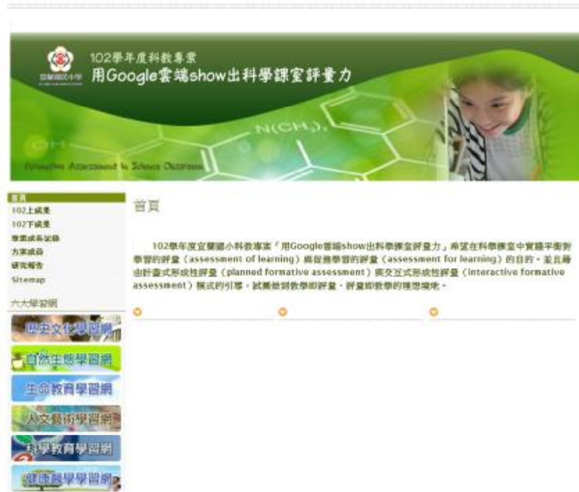
圖 4 專案網頁