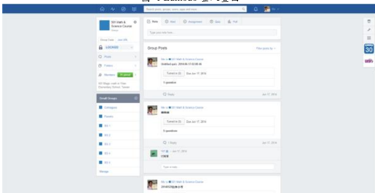
圖 2 Edmodo 課程首頁