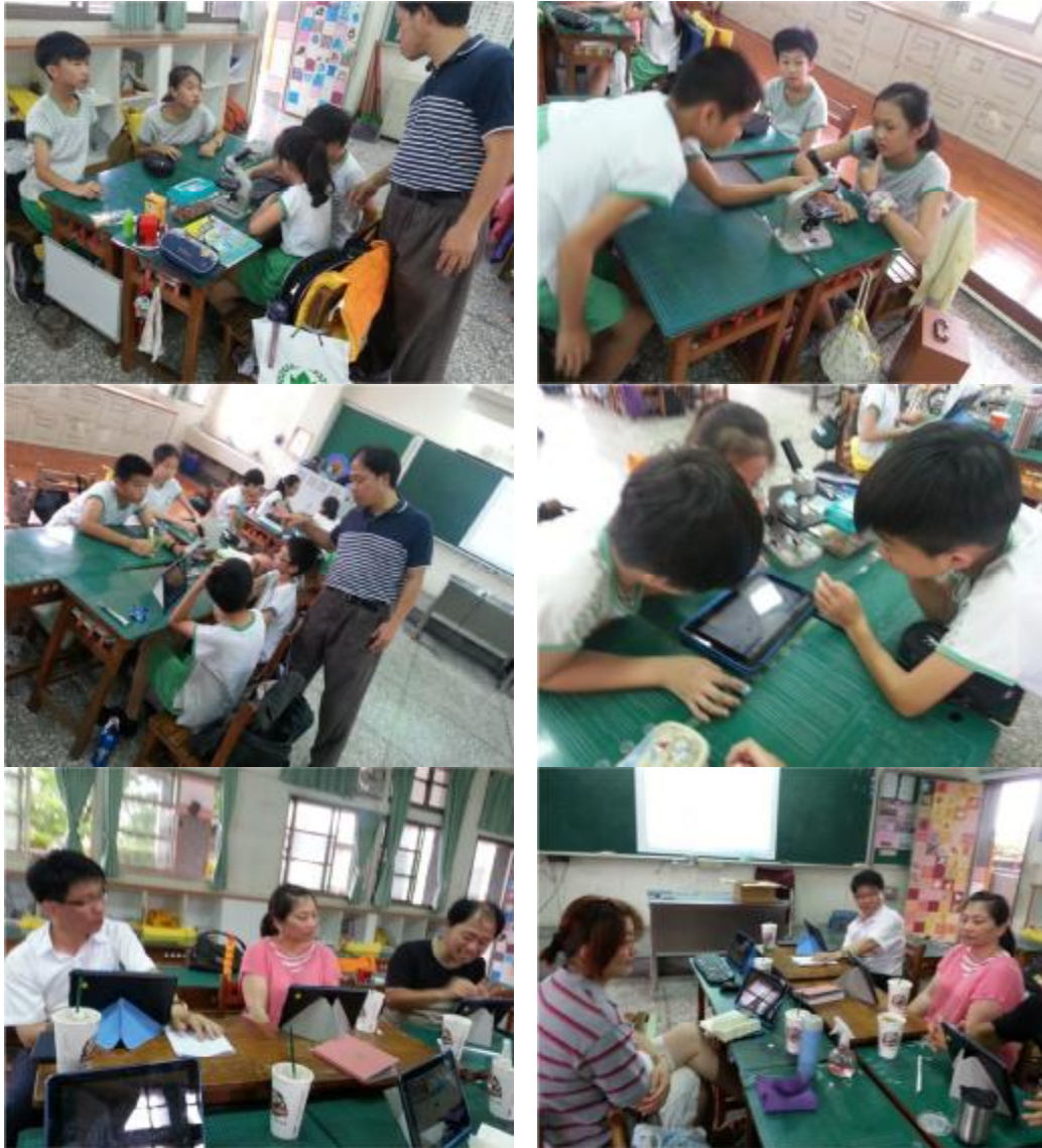
圖 3 教學觀察與課後討論